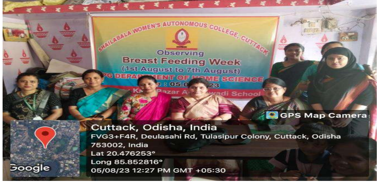
Awareness on Breast Feeding at Kafla Anganwadi Centre, Cuttack