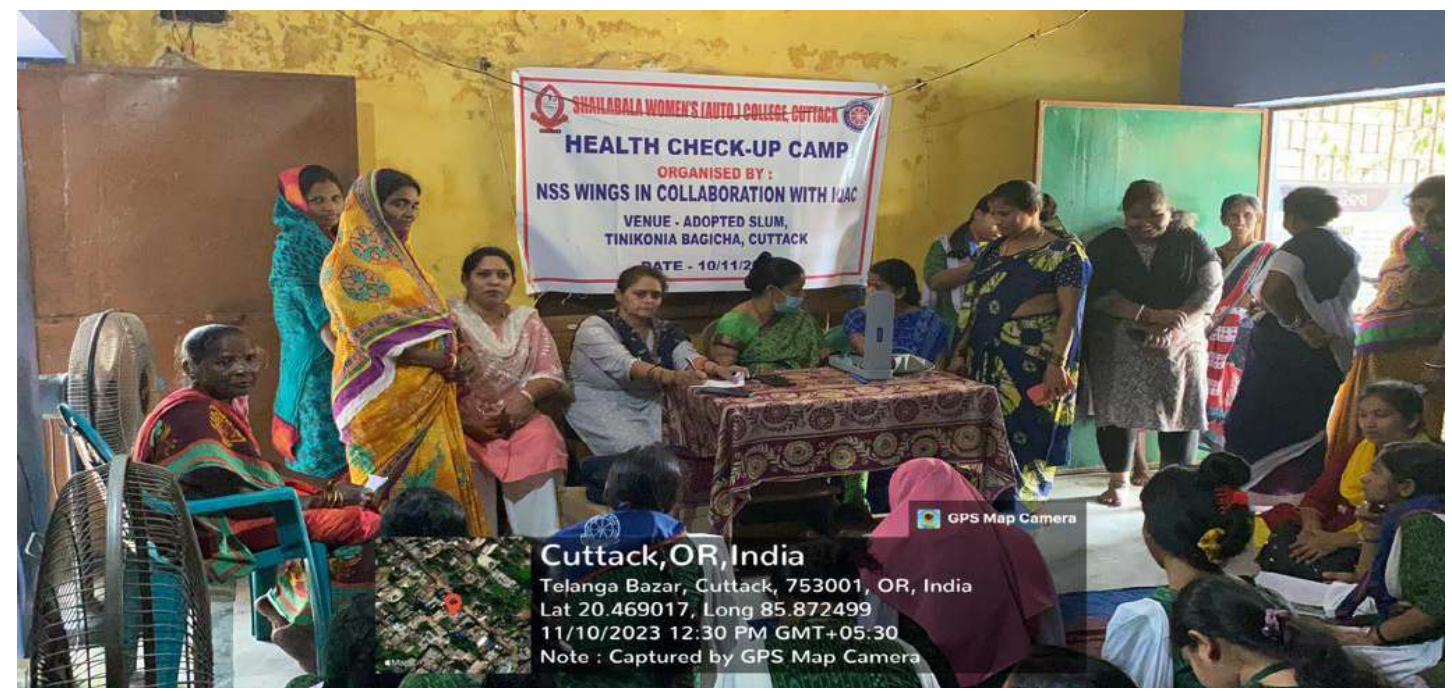
Health Check-up Camp at Tinikonia Bagicha, Cuttack