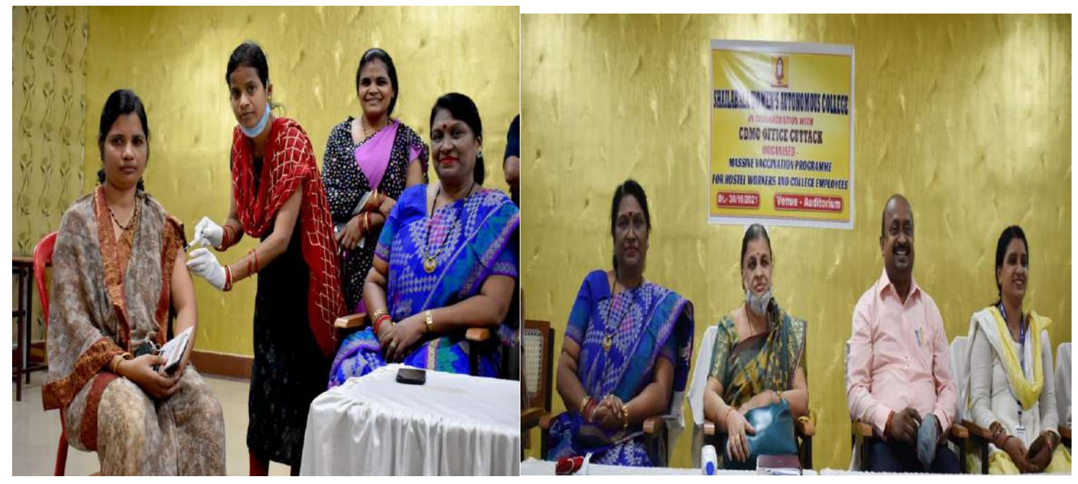
Massive vaccination programme

Awareness on Health and Hygiene for Pattapola slum dwellers at Pattapola, Cuttack