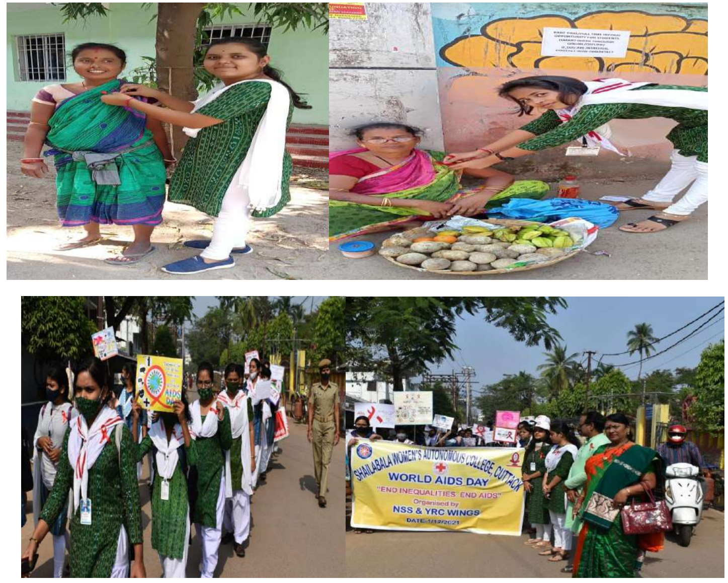
Awareness programme on AIDS prevention and control