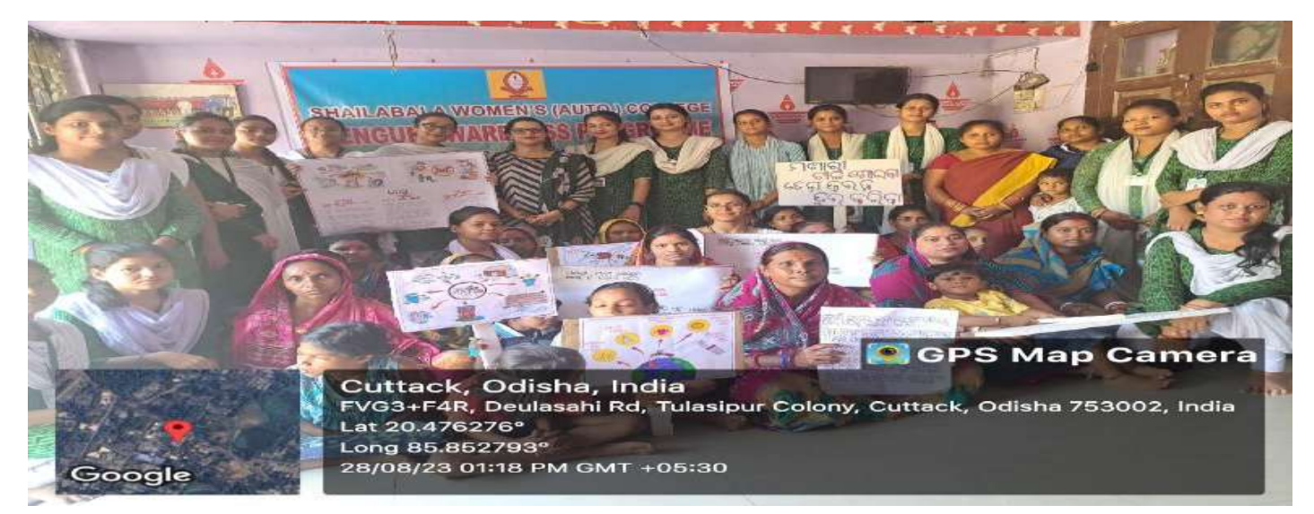
Dengue Awareness Programme at Harijan Sahi, Kafla Bazar, Cuttack