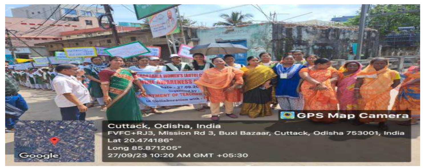
Awareness on Dengue at Buxi Bazar, Chandi Chaka, Patapola and Samaj Office, Cuttack