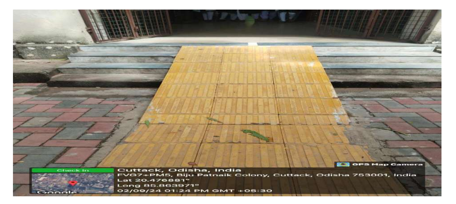
Tactile Path for Divyangjan